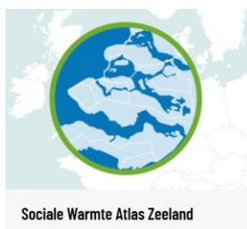
Sociale Warmte Atlas Zeeland

In het Traject Energieke Gemeenten zijn vier hulpmiddelen ontwikkeld om inwonerparticipatie in de warmtetransitie handen en voeten te geven. Ze zijn bedoeld voor Zeeuwse gemeenten, inwonersgroepen en organisaties die hen ondersteunen.